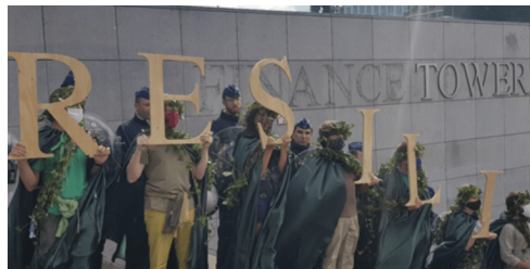
Extinction Rebellion België

( https://www.dewereldmorgen.be/artikel/2020/07/02/aankondiging-illegale-annexatie-van-delen-van-westelijke-jordanoever-schending-internationaal-recht/ )