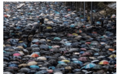
Amnesty International Vlaanderen

( https://www.dewereldmorgen.be/artikel/2020/06/30/extinction-rebellion-stuurt-geleende-letters-financie-ren-naar-politieke-partijen/ )