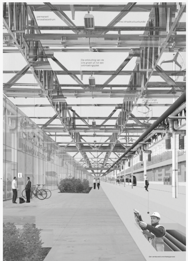
Circulaire heractivatie van de Ford site.

(5) Multiproductief Netwerk Kolenspoor (2016, door: Plusoffice Architects, Delva Landscape Architects, Living Lab de Andere Markt i.o.v. Stad Genk en Thuis in de Stad) test het kolenspoor en aangrenzende braakliggende terreinen als een infrastructuur drager voor kleinschalige lokale voedsel-, energie-, en materiaalpraktijken en -netwerken. Een meerschakelende ruimtelijke lezing, veldwerk en workshops rond een interactieve maquette leidde tot drie ontwikkelingstrajecten voor het kolenspoor in Genk: een landschapsbelevingspark, een kringloopmachine en een productielus.