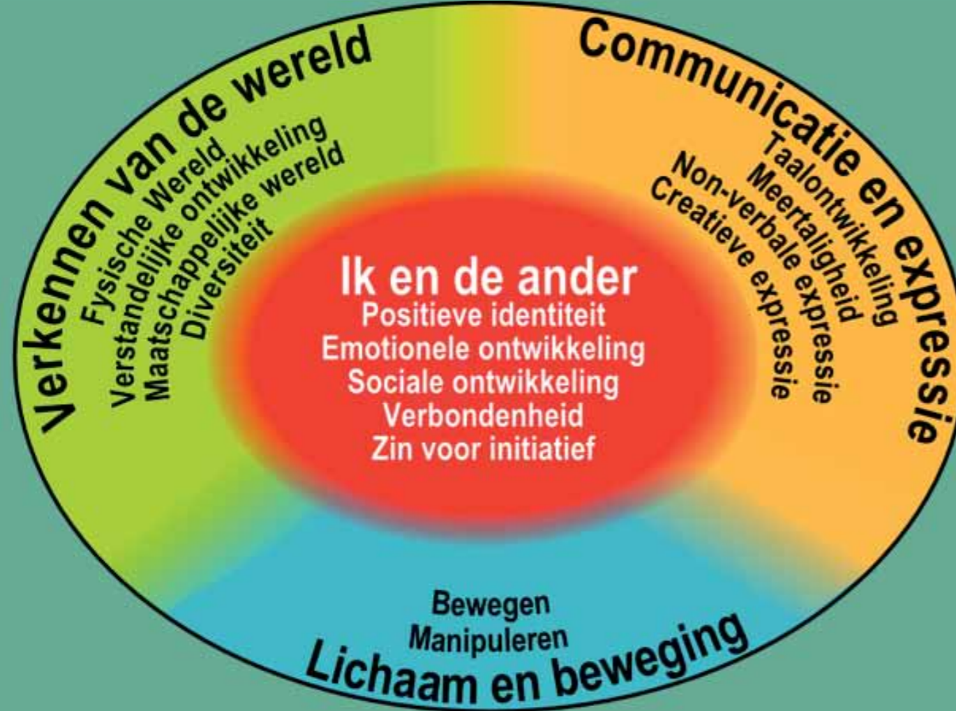
Figuur 1: De vier ervaringsgebieden met sleutelervaringen

Met de ervaringsgebieden zet het raamwerk bakens uit voor een waarderende en uitdagende leefomgeving, met respect voor het individuele ritme, talenten, de eigenheid en het initiatief van elk kind. Elke benutting van de ervaringsgebieden blijft onderworpen aan de kernvoorwaarden van kwaliteit: kinderen voelen zich goed en zijn geboeid bezig.