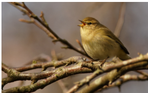
Een tjiftjaf.

Toch is dit exact wat er gebeurt in de berichtgeving en de debatten over mensen die via ons land naar een ander land willen gaan. De afgelopen weken zijn deze mensen volop in het nieuws. De termen 'transmigranten' en 'transitmigranten' wisselen elkaar hierbij voortdurend af en lijken wel synoniemen van elkaar te zijn. Dit zijn ze echter niet. Het gebruik van beide termen door elkaar is verwarrend en helpt het debat niet vooruit.