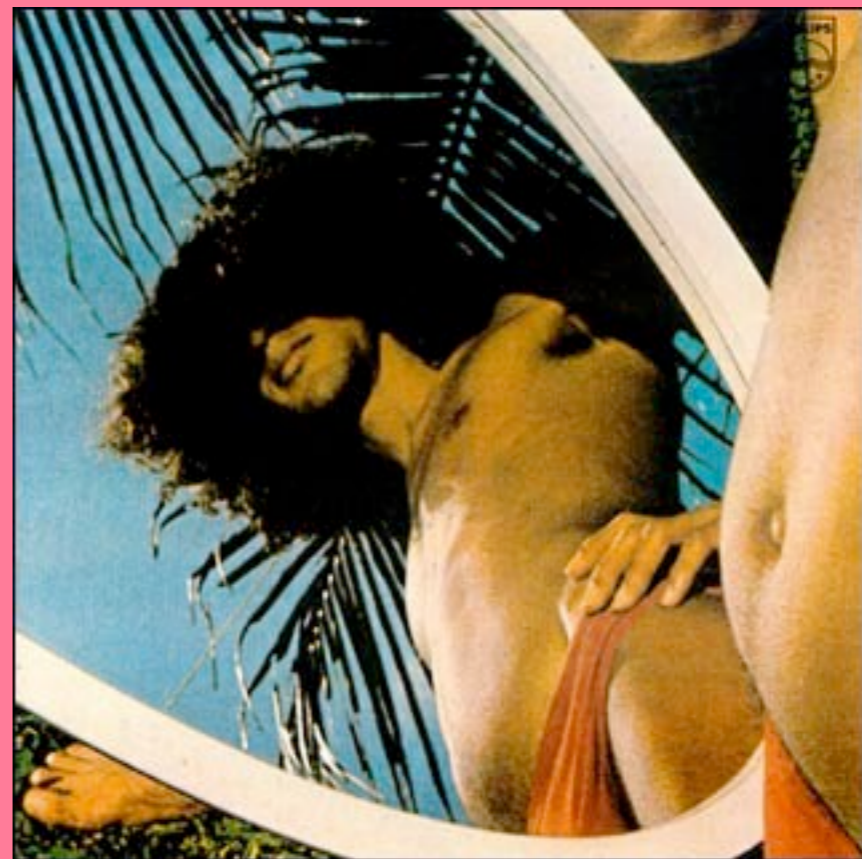
Araçá Azul (Caetano Veloso)