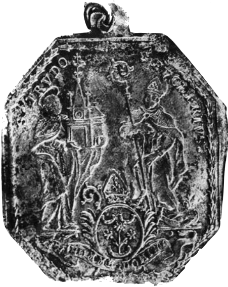
Pelgrimsmedaille van de Sint-Trudoabdij met voorstelling van de heiligen Trudo en Eucherius, 17de eeuw.