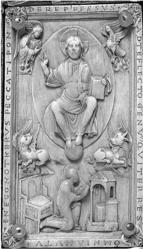
Ivoren reliëf van de band van het evangelarium van de Luikse bisschop Notger, ca. 990. De knielende figuur onder Christus is Notger.