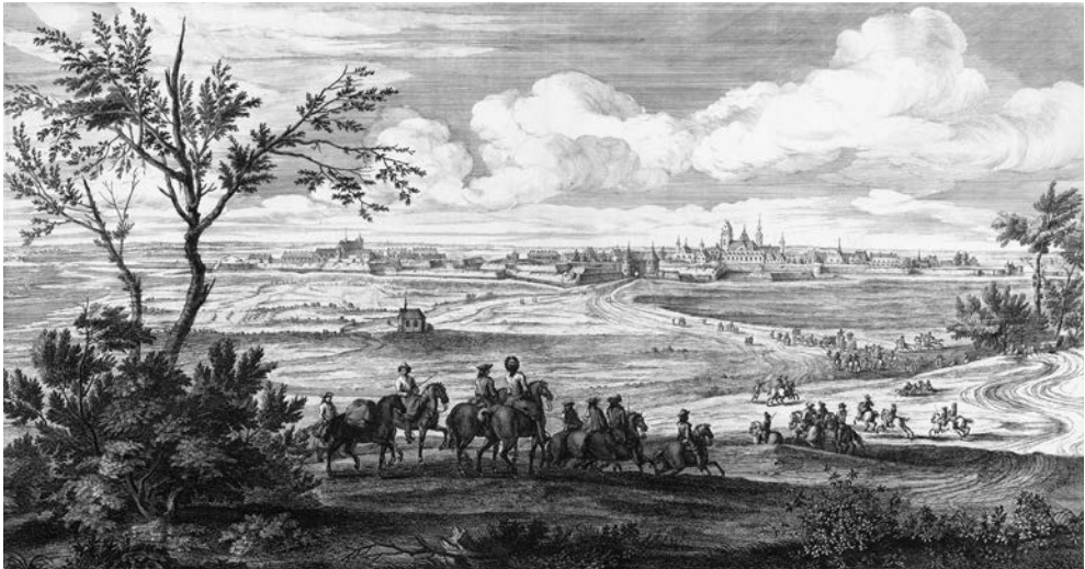
Gezicht op Zoutleeuw, 1678. Gravure naar een tekening van Adam Frans van der Meulen, Parijs, 1685. Met links van het midden (onder de rechts tak van de boom) de Sint-Sulpitiuskerk en rechts van het midden de Sint-Leonarduskerk.

[Amsterdam, Rijksmuseum: RP-P-OB-82.787]