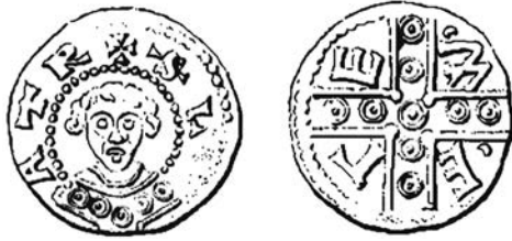
Elfde-eeuws muntstuk van Zoutleeuw met (mogelijke) verwijzing naar Sint-Lambertus van Luik. [Revue de la Numismatique Belge, 1865, pl. XXI, nr. 34]