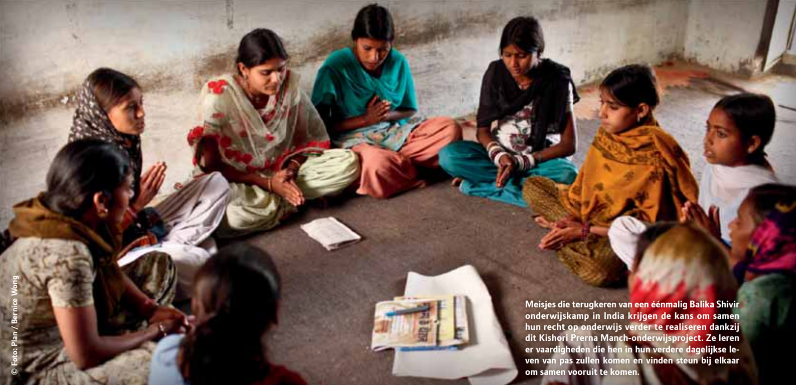
Meisjes die terugkeren van een éénmalig Balika Shivar onderwijskamp in India krijgen de kans om samen hun recht op onderwijs verder te realiseren dankzij dit Kishori Prerna Manch-onderwijsproject. Ze leren er vaardigheden die hen in hun verdere dagelijkse leven van pas zullen komen en vinden steun bij elkaar om samen vooruit te komen.