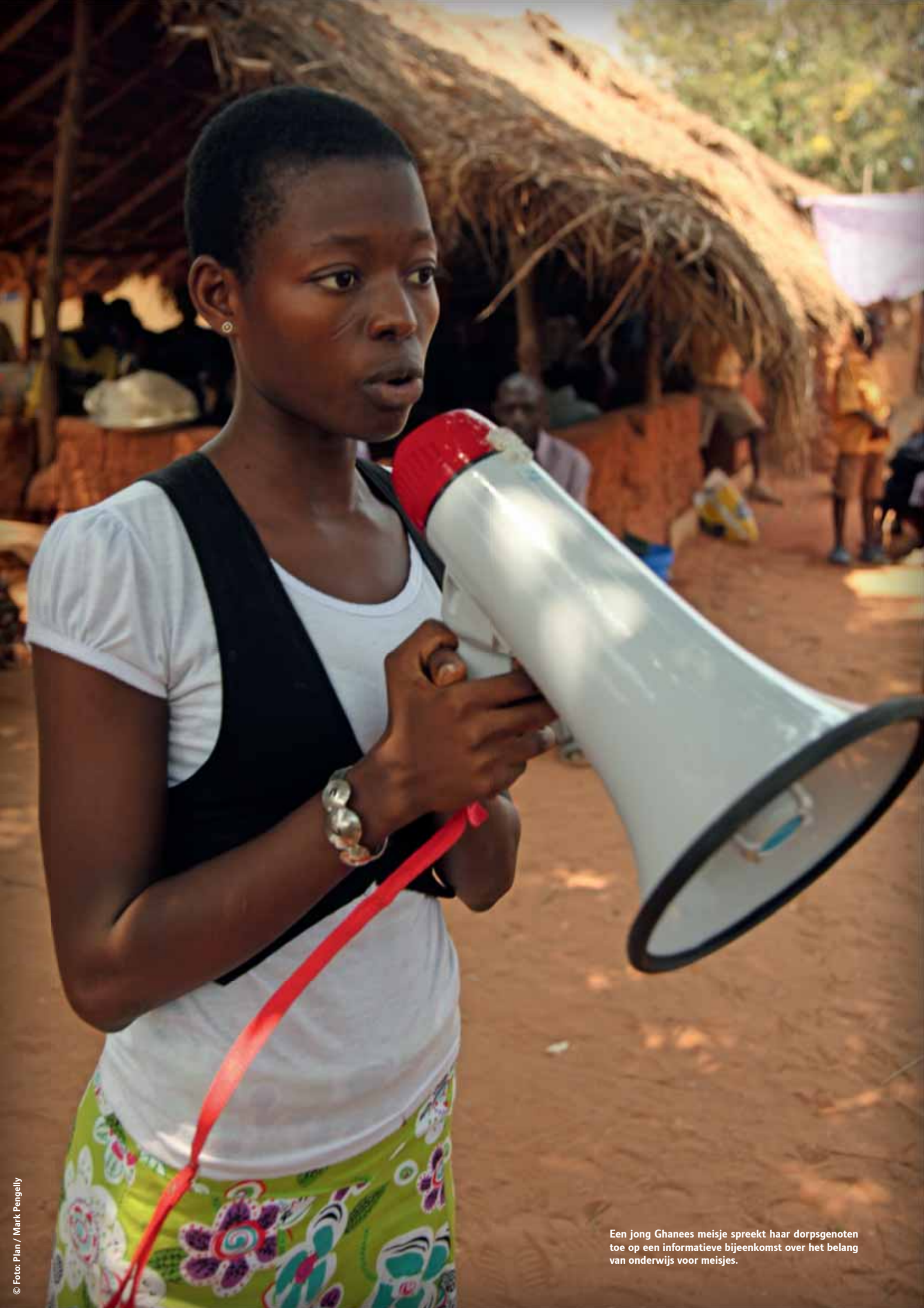
Een jong Ghanees meisje spreekt haar dorpsgenoten toe op een informatieve bijeenkomst over het belang van onderwijs voor meisjes.