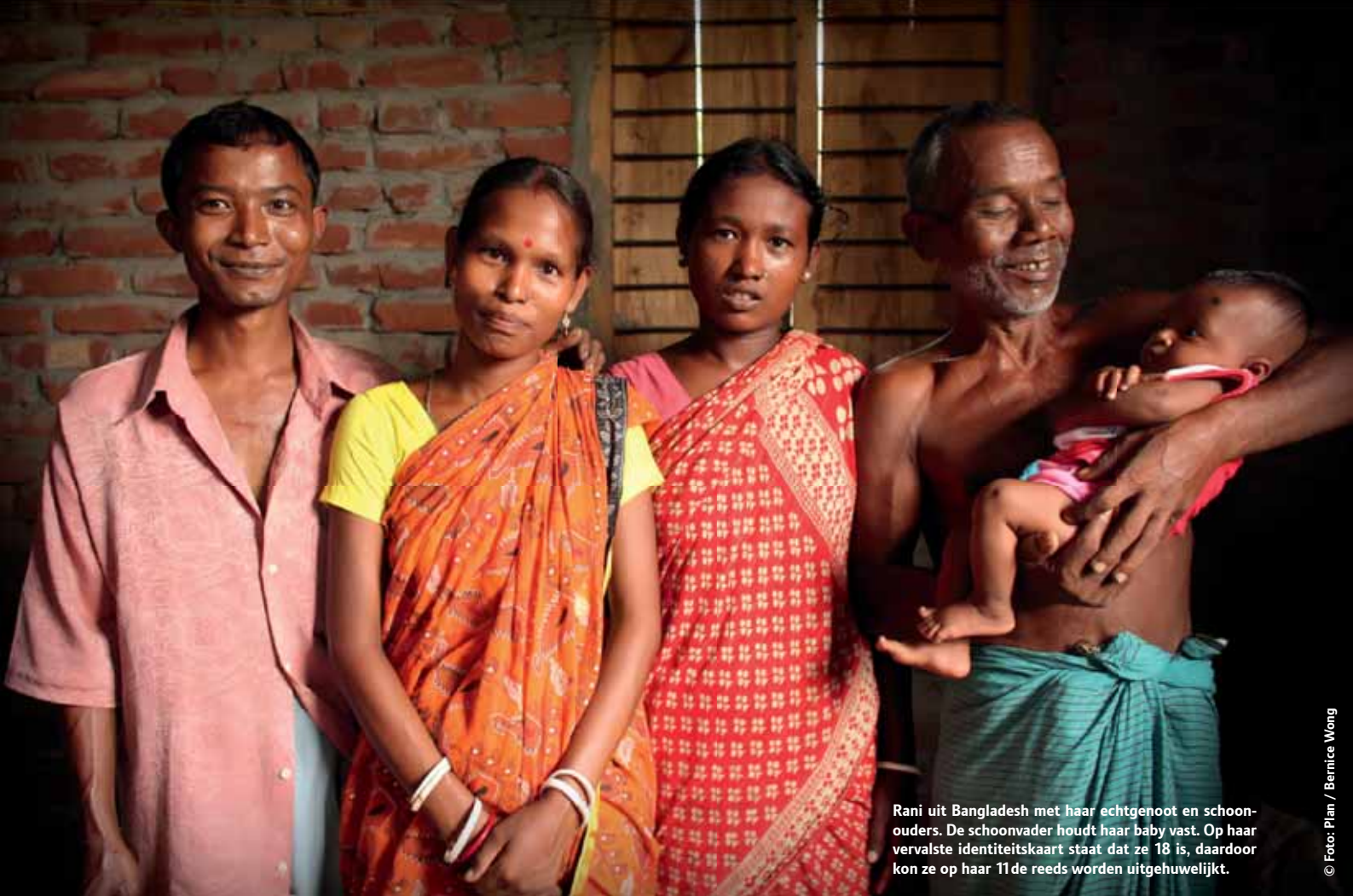
Rani uit Bangladesh met haar echtgenoot en schoonouders. De schoonvader houdt haar baby vast. Op haar vervalste identiteitskaart staat dat ze 18 is, daardoor kon ze op haar 11de reeds worden uitgehuwelijkt.