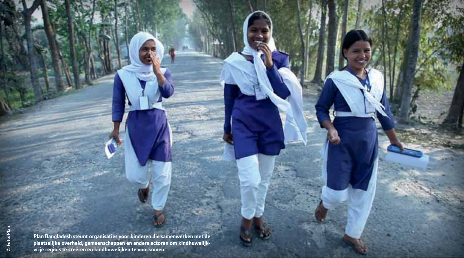
Plan Bangladesh steunt organisaties voor kinderen die samenwerken met de plaatselijke overheid, gemeenschappen en andere actoren om kindhuwelijk-vrije regio's te creëren en kindhuwelijken te voorkomen.