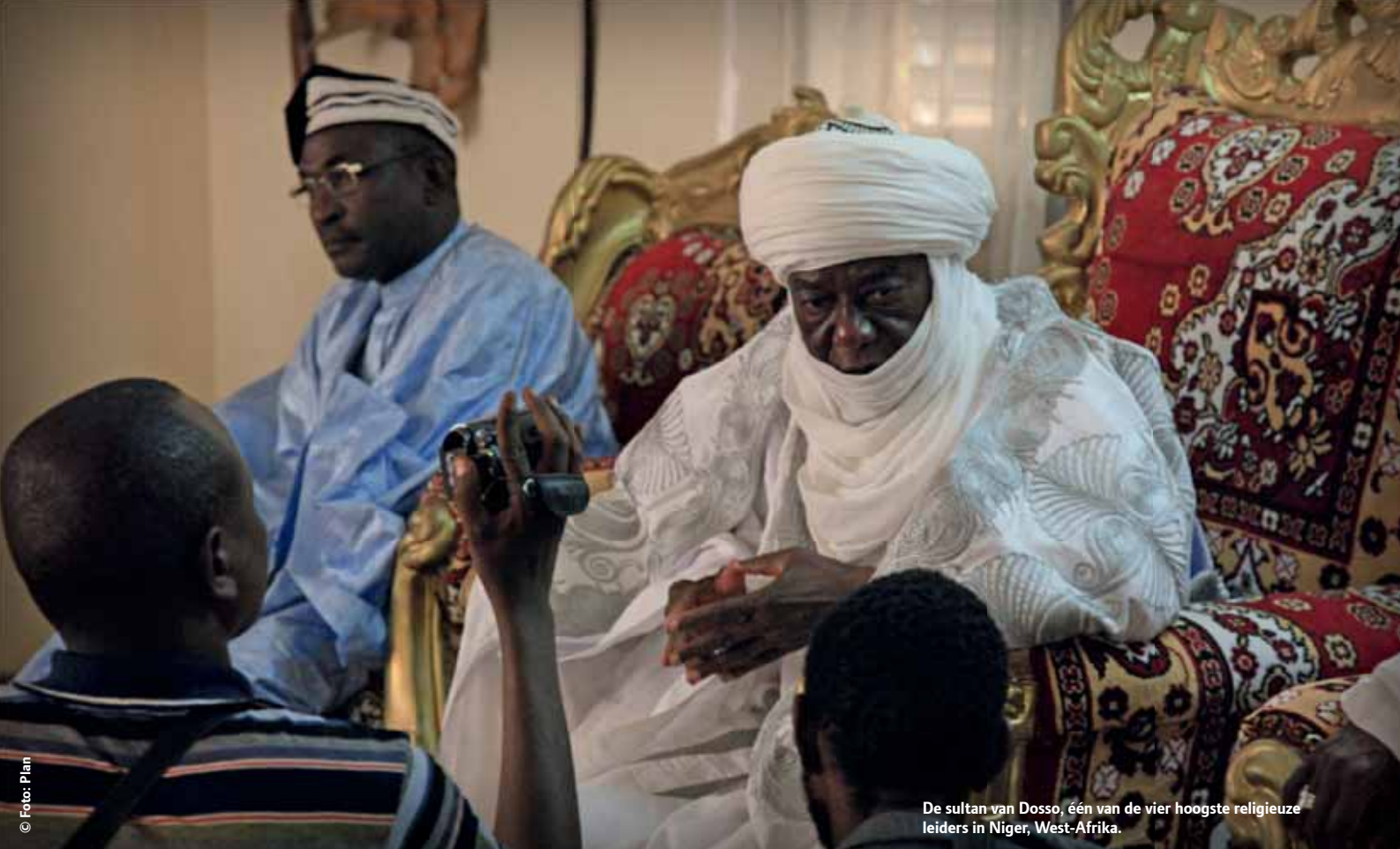
De sultan van Dosso, één van de vier hoogste religieuze leiders in Niger, West-Afrika.