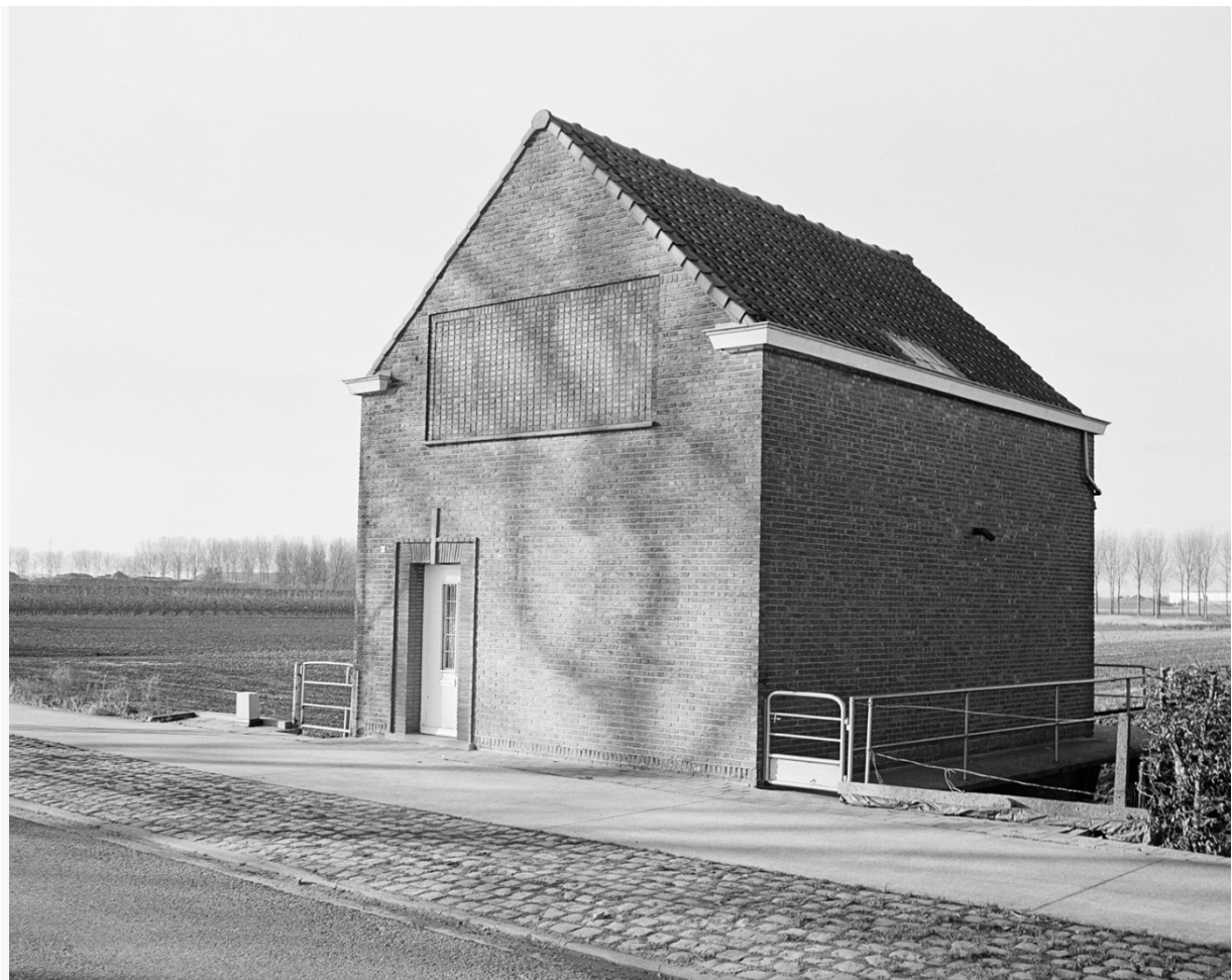
Dieter van Caneghem, ‘Bevreemding 01’, 2013.

Met de beelden ‘bevreemding 01’ en ‘bevreemding 02’ nodigt fotograaf Dieter van Caneghem ons uit om stil te staan bij de ontmoetingen met deze niet geplande of tussen de plooiën van de geplande ontwikkelde objecten. Deze weerbarstige objecten, die we aantreffen in de blanco gebieden die tussen de centra in, kunnen en mogen we in het pleidooi voor de horizontale metropool niet negeren. Objecten, dingen steeds meer dingen die zo eindeloos en ongecontroleerd zijn gaan woekeren in ons verrommelde landschap van kakafonische