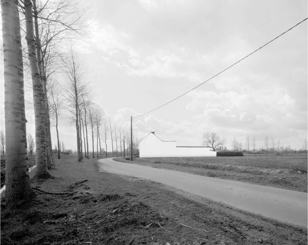
Dieter van Caneghem, 'Dualiteit 01', 2013.