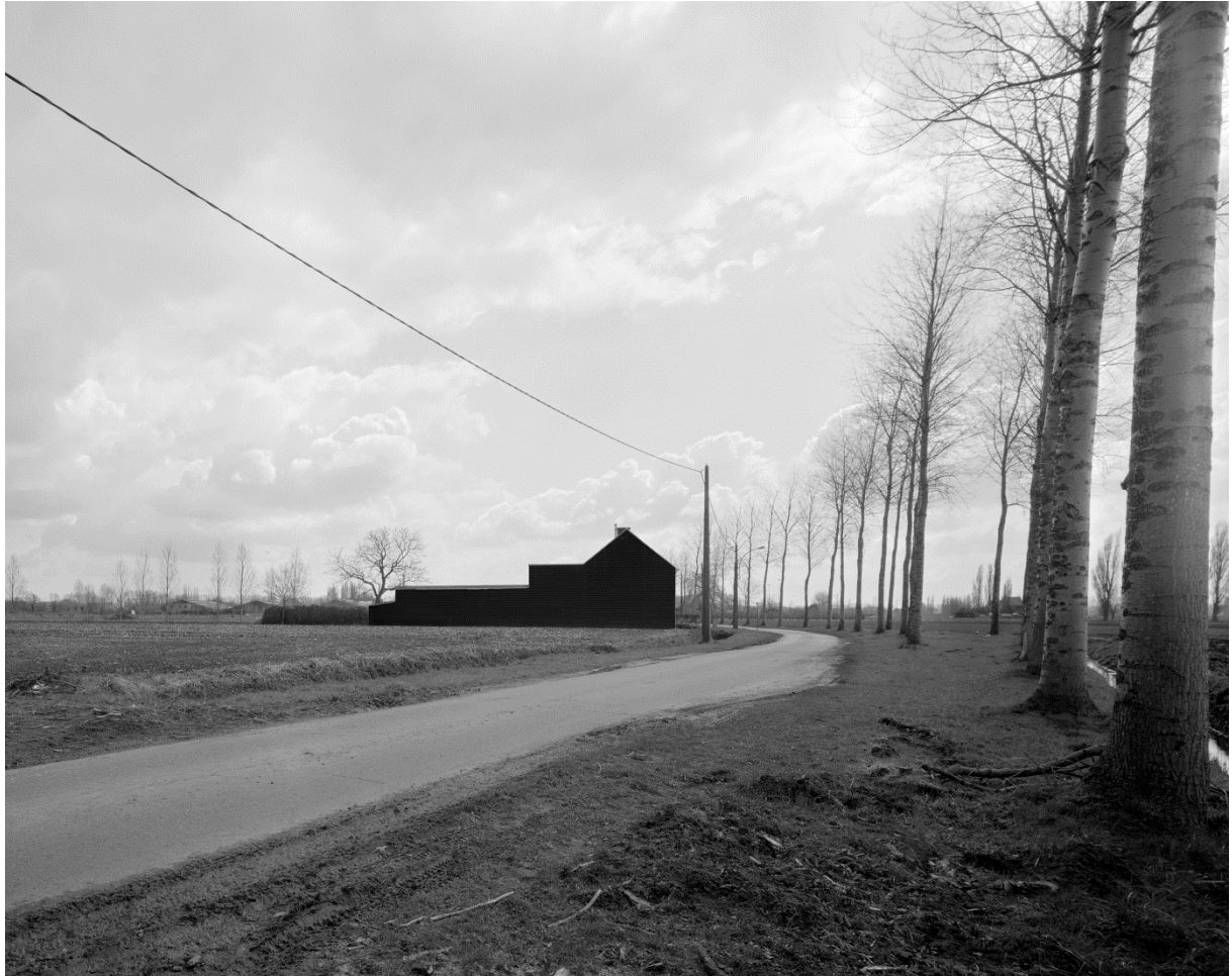
Dieter van Caneghem, 'Dualiteit 02', 2013.

'De compositie is van kapitaal belang. Zij scheidt de orde, geeft ieder personage en object een plaats en schikt de lijnen van het schilderij, rechte, horizontale of schuine. Zij verdeelt schaduw en licht en geeft aan ieder figuur of voorwerp zijn karakter, uitdrukking en eigen leven.' (Jean Brusselmans)