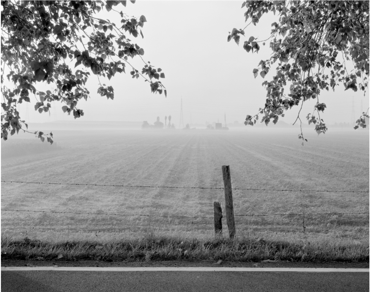
Dieter van Caneghem, 'Bevremding 02', 2013.

nevenschikking. Eens we deze ‘objets bouleversants’ (Paul Nougé) hebben opgemerkt krijgen deze op het eerste zicht banale objecten uit onze dagelijkse omgeving een zekere bijzonderheid en prikkelen ze onze verbeelding. Het beelddenken of de zuidelijke cultuur van het beeld, niet als eindbeeld of blauwdruk, maar als een proces dat hieraan ten grondslag ligt.