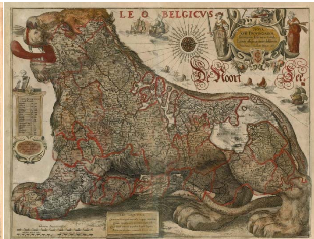
Jodocus Hondius, 'Leo Belgicus', 1611.

Binnen de 16de en 17de eeuwse cartografische conventie die de zeventien provincies in de vorm van een leeuw weergaven, volstaat het om de kaart van de Amsterdamse producent van atlanten en landkaarten Claes Janszoon Visscher naast deze van de Vlaamse Cartograaf Jodocus Hondius te plaatsen om tot de vaststelling te komen dat hun 'Leo Belgicus' respectievelijk weg van en richting Vlaanderen kijkt. Terwijl in Nederland Rem Koolhaas aan zijn boek 'The Belgian Way' over de kunst van het compromis werkt, lezen we in de publicatie 'The ambition of the territory, Vlaanderen als ontwerp' (2012) dat we strategieën moeten ontwikkelen in plaats van het compromis op te zoeken. De Vlaamse Bouwmeester Peter Swinnen schreef reeds twee jaar eerder in zijn 'zeven memo's voor een verlichte bouwcultuur' dat we moeten durven kiezen wat hij gelijksteld met masterplanning en waarbij het compromis als het tegendeel van de keuze wordt omschreven. Wat is er gaande binnen de Delta-metropool? Waarom kijken we voortdurend de andere richting uit, dus naar elkaar? Is dit 'dépaysment' louter te verklaren vanuit een nieuwsgierigheid, verwondering en fascinatie voor de afstand en de nabijheid van het andere of maakt het kruisen van onze blik ons net terug gevoelig voor dat wat we zelf niet meer zagen. In deze bijdrage voor 'Vol Vlaanderen' wordt gefocust op de stedenbouwkundige en planologische ping-pong tussen onze twee naties om tot slot stil te staan bij dat wat voor onze noorderburen zo zuiders is.