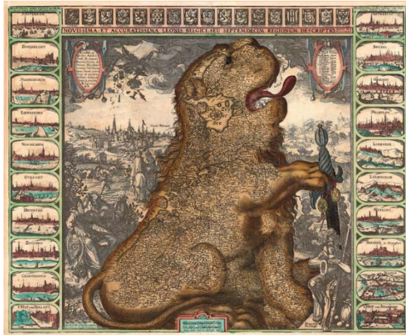
Claes Janszoon Visscher, 'Leo Belgicus', 1609.