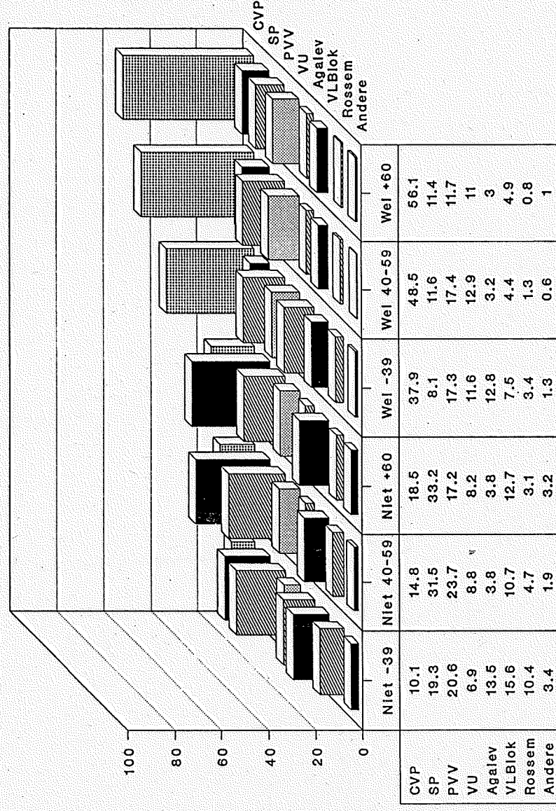
Grafiek 1. Stemgedrag naar leeftijd en kerkelijke betrokkenheid bij de Parlementsverkiezingen van 1991, Vlaanderen.

Aangepast en geschat onder passend model