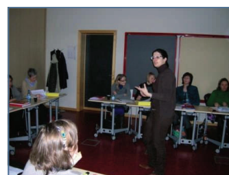
Formación en Luxemburgo