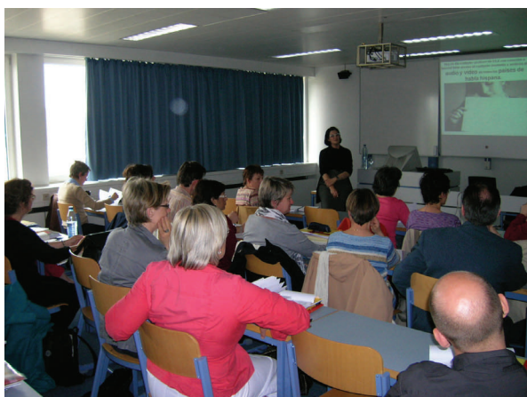
IX Jornada Pedagógica en Bruselas

El programa completo de la Jornada que incluye los resúmenes de los talleres y otros detalles de carácter práctico puede descargarse desde este enlace . La inscripción es gratuita y está abierta a todos los profesores de español. El plazo está abierto desde el 1 de marzo hasta el 15 de abril o hasta que se agoten las plazas disponibles. Para inscribirse hay que descargar el formulario de inscripción desde este enlace y enviarlo a asesoriabelgica.be@educacion.es .