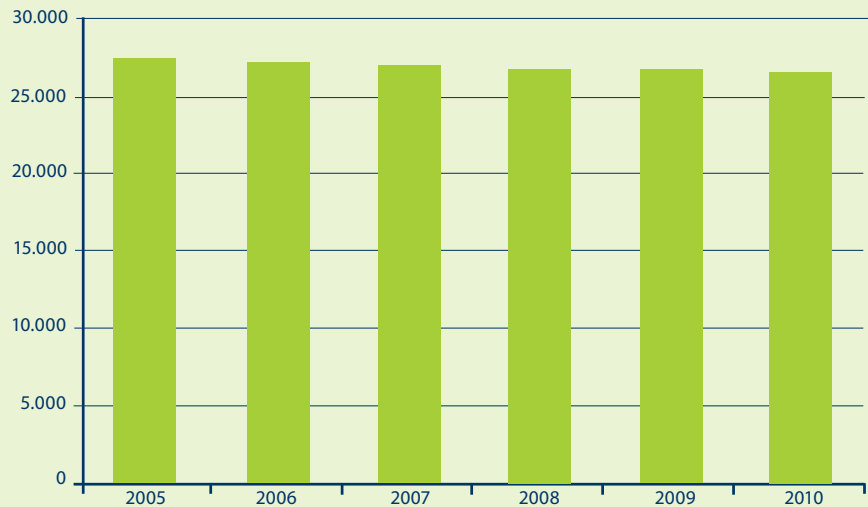
Grafiek 1 Evolutie aantal coöperatieve vennootschappen (in normale juridische toestand) in België